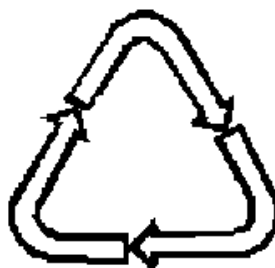
Рисунок 4 - возможность утилизации использованной упаковки (укупорочных средств) - петля Мебиуса